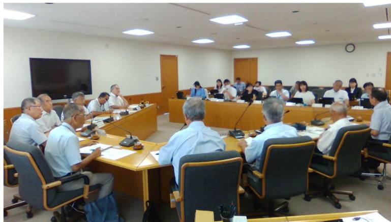
全 10 自治会長との情報交換会